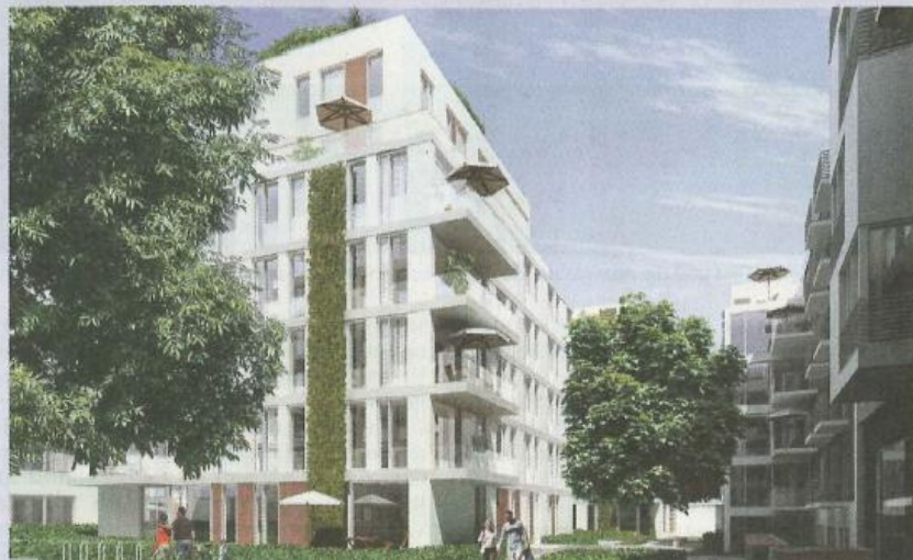
Im Schnitt 3.600 Euro/m 2 kostet ein neues Heim in den Choriner Höfen.